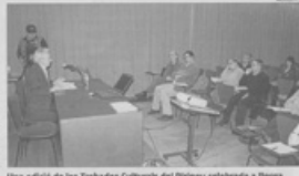
Una edició de les Trobades Culturals del Pirineu celebrada a Berga

dosa cap al Pirineu», de Lluís Obiols i Carlos Galardi; «Tremolatorials de Tòrbis a la Identitat», a càrrec d'Isidre Domergat; «Amb les cançons amb el cor: Víctor Ferrer i el cant popular», de Jordi Puigros; i «L'exploració del patrimoni natural a la Cerdanya: una nova febre econòmica?», d'Ignasi Quilès.