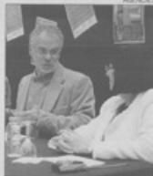
La presentació del llibre.